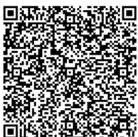
Diagnóstico do manejo de resíduos sólidos urbanos