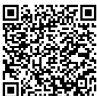
Manual de Compostagem Doméstica - Ministério do Meio ambiente