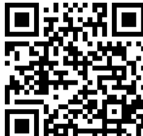
Programa de Compostagem Doméstica - Venâncio Aires